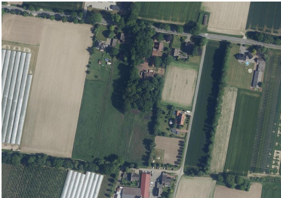
Abbildung 1: Auszug aus den Niedersächsischen Umweltkarten (02/2024)