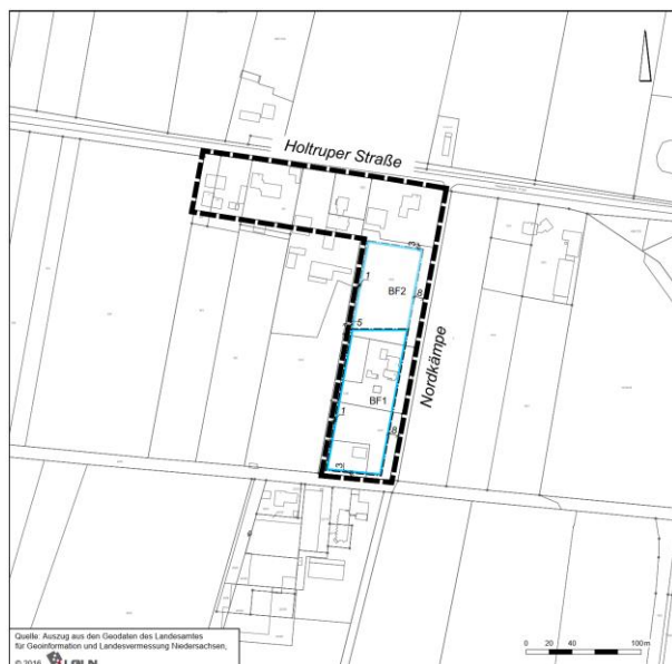
Abbildung 4: Geltungsbereich der Außenbereichssatzung

Der Geltungsbereich der Außenbereichssatzung umfasst Flächen westlich der Straße „Nordbäke“ und südlich der Holtruper Straße der Ortschaft Holtrup in der Stadt Vechta gem. anliegender Beikarte. Die Beikarte ist Bestandteil dieser Satzung. Konkret umfasst das Satzungsgebiet die folgenden Flurstücke: 8/2 tlw., 8/3 tlw., 9/1 tlw., 10/2, 10/3 tlw., 13/5 tlw., 13/6 tlw., 13/7, 13/8 tlw., der Flur 6, der Gemarkung Langförden.